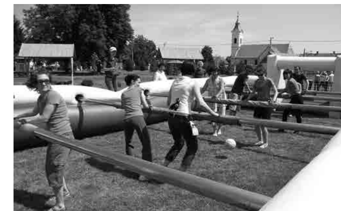
TEAM BUILDING 12. I 13. GENERACIJE, BARANJA 2009.

Kolegij uvodi studente u pojmove poslovne etike i korporacijske društvene odgovornosti, s posebnim naglaskom na značaj tih kategorija poslovnog ponašanja u malim i srednjim poduzećima. Poslovna etika i korporacijska društvena odgovornost promatraju se kao poluge ostvarivanja održive konkurentnosti. Izvođenje predmeta temelji se na intenzivnom uključanju studenata u analizu aktualnih slučajeva iz područja poslovne etike i korporacijske društvene odgovornosti, te raspravama s poduzetnicima koji svoje iskustvo prezentiraju kao gosti predavači.