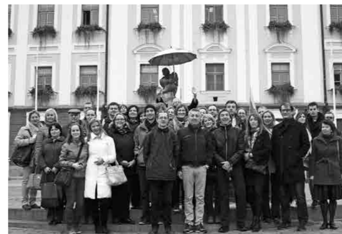
STUDIJSKO PUTOVANJE U ESTONIJU (LISTOPAD 2013.)

* Ukoliko želite čuti i naučiti kako nastaju uspješne poduzetničke priče iz usta samih poduzetnika, napredovati u poslu, upoznati nove prijatelje, naučiti se timskom radu, naporno raditi, ali i zabaviti se onda je ovaj studij pravo mjesto za vas.*