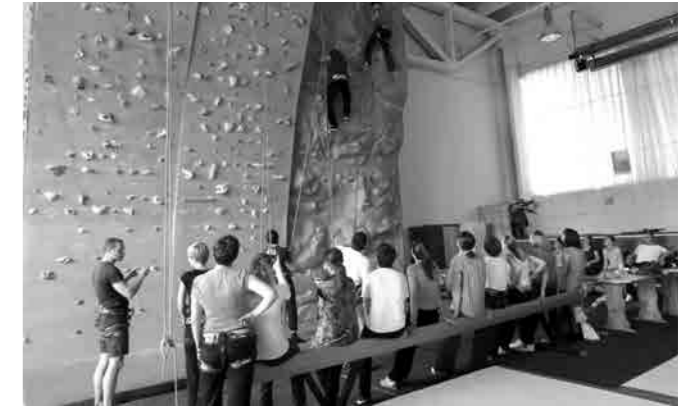
TEAM BUILDING 14. GENERACIJE, SPORTSKO PENJANJE NA UMJETNOJ STIJENI, 2011.

Kolegij daje uvid u široki spektar bitnih vještina potrebnih poduzetniku i menadžeru u svakodnevnom vođenju posla. Tematske cjeline ovog kolegija su: razvijanje samosvijesti; upravljanje stresom; analitički pristup problemu; kreativno rješavanje problema; vrednujuća i podržavajuća komunikacija; moć i utjecaj; upravljanje konfliktnim situacijama; motivacija; osnaživanje i delegiranje; timski rad; upravljanje pozitivnim promjenama. Ovladavanje svim ovim vještinama je ključni element za uspjeh u upravljanju bilo kojim sistemom, od poduzeća, neprofitne organizacije, lokalne uprave.