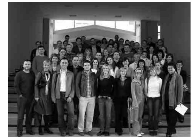
COURTNEY THORNE-SMITH SUDJELOVALA U RAZGOVORU SA STUDENTIMA 9. GENERACIJE PSPa, 2006.