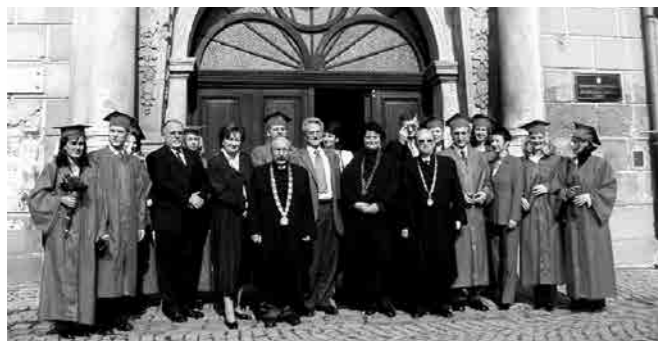
GEORGE SOROS, NA PRVOJ PROMOCIJI MAGISTARA ZNANOSTI IZ PODUZETNIŠTVA, 14. LISTOPADA 2002. GODINE.

Ekonomski fakultet u Osijeku jedan je od najstarijih fakulteta Sveučilišta Josipa Jurja Strossmayera u Osijeku. Osnovan je 1961. godine, kao nastavak aktivnosti Centra za ekonomski studij zagrebačkog sveučilišta, uz veliku podršku tadašnjeg gospodarstva, gospodarske komore, te institucija lokalne i regionalne vlasti. Ta "regionalna" utemeljenost odredila je od samog početka i profil fakulteta: u istraživačkom radu usmjerenog ka problemima regionalnog razvoja i razvoja poduzeća, a u obrazovnim programima usmjerenog ka problematici organizacije poslovanja i upravljanje poduzećem. Do kraja 2013. godine na Ekonomskom fakultetu u Osijeku diplomiralo je 10 316 studenata na dodiplomskom studiju, 345 studenata steklo je diplomu sveučilišnog specijalista ekonomije, 691 student stekao je diplomu magistra znanosti, a 191 student je obranio doktorsku disertaciju.