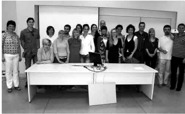
STUDENTI 13. GENERACIJE NA KOLEGIJU "PODUZETNIŠTVO IZ POLICY PERSPEKTIVE"