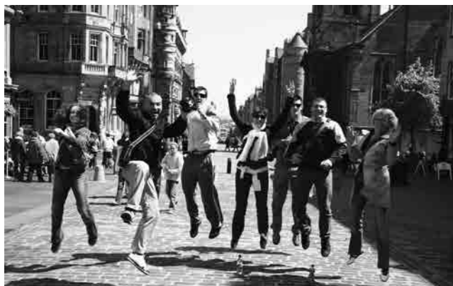
STUDIJSKO PUTOVANJE U ENGLSKU I ŠKOTSKU (SVIBANJ, 2008.)